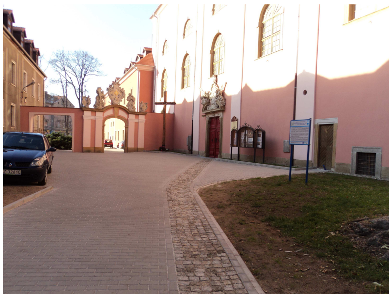
Fotorelacja z postępu prac z dnia 16.01.2012 r.